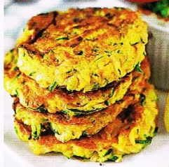
ИДЕЯ! ОВОЩНЫЕ ОЛАДЫ БЕЗ МУКИ с. 28