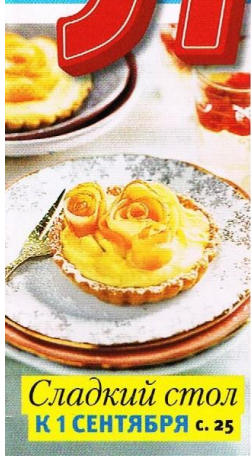
Сладкий стол К 1 СЕНТЯБРЯ с. 25

ИЗ СТАРОГО СТУЛА: перделка в стиле Прованс с. 33